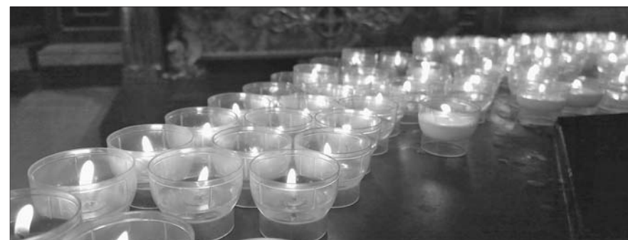
Estas respuestas están tomadas del Catecismo Joven de la Iglesia Católica. Los números que se ofrecen corresponden a la versión de YOUCAT.

El año litúrgico o año cristiano es la superposición del transcurso normal del año con los misterios de la vida de Cristo: desde la Encarnación hasta su retorno en gloria. El año litúrgico comienza con el Adviento, el tiempo de la espera del Señor, tiene su primer punto culminante en el ciclo festivo de la Navidad y el segundo, aún mayor, en la celebración de la Pasión, Muerte y Resurrección de Cristo en la Pascua. El tiempo pascual termina con la fiesta de Pentecostés, el descenso del Espíritu Santo sobre la Iglesia. Las fiestas de la Virgen María y de los santos jalonan el año litúrgico; en ellas la Iglesia alaba la gracia de Dios, que ha conducido a los hombres a la salvación.