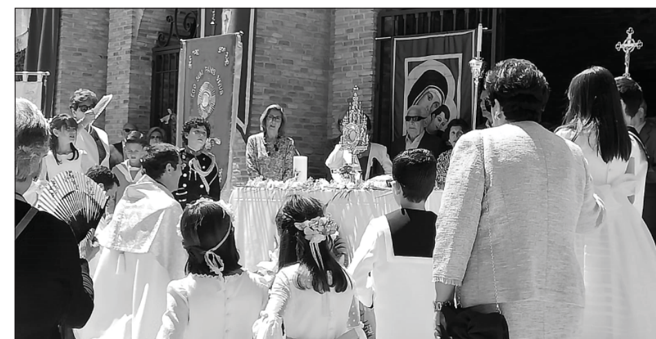
■ PROCESIÓN DEL CORPUS. El domingo 3 de junio, la parroquia llevó a cabo la procesión con el Santísimo Cuerpo de Cristo por el itinerario de costumbre. Este año tomó parte una notable afluencia de fieles y fue vivido con gran respeto y devoción.

Demuestra que Dios es alegre: Como cristianos tenemos el deber de mostrar con optimismo la alegría del Evangelio.