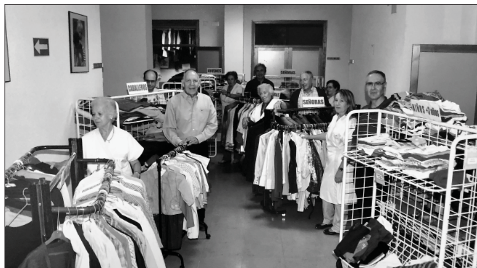
Parte del equipo de voluntarios de Caritas Parroquial atendiendo el servicio de ropero.