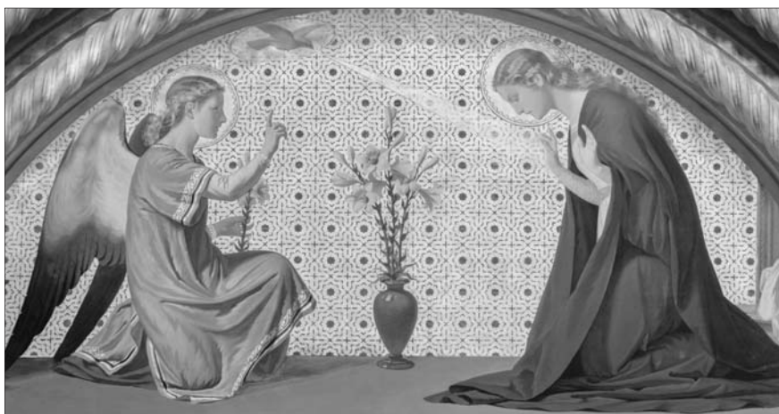
Estas respuestas están tomadas del Catecismo Joven de la Iglesia Católica. Los números que se ofrecen corresponden a la versión de YOUCAT.

Por eso la Iglesia tiene santuarios marianos de peregrinación, fiestas, canciones y oraciones marianas, como por ejemplo el rosario que es un resumen del Evangelio.