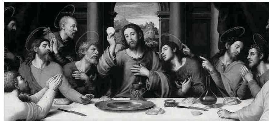
Los números se corresponden con las respuestas del catecismo YOUCAT.

Con las mismas fuerzas humanas que tenemos todos nosotros Jesús tuvo que luchar por su asentimiento interior a la voluntad del Padre de dar su vida para la vida del mundo. En su hora más difícil, abandonado por todo el mundo e incluso por sus amigos, Jesús se decidió finalmente por un sí. "Padre mío, si este cáliz no puede pasar sin que yo lo beba, hágase tu voluntad".