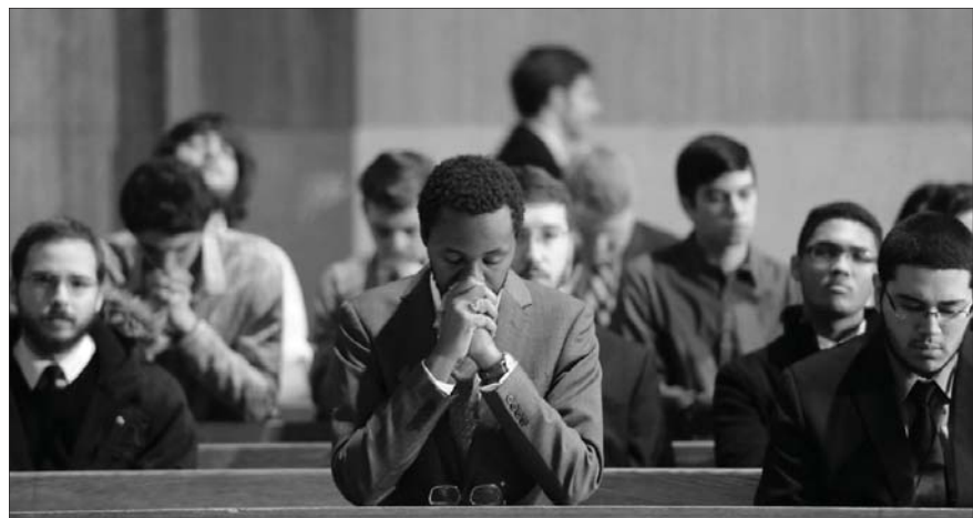
¿Quieres saber más? Estas respuestas están tomadas del YOUCAT. Consúltalo.

Nuestros encuentros con Cristo en la oración, los sacramentos y en obras de caridad deben hallarse entre nuestras prioridades.