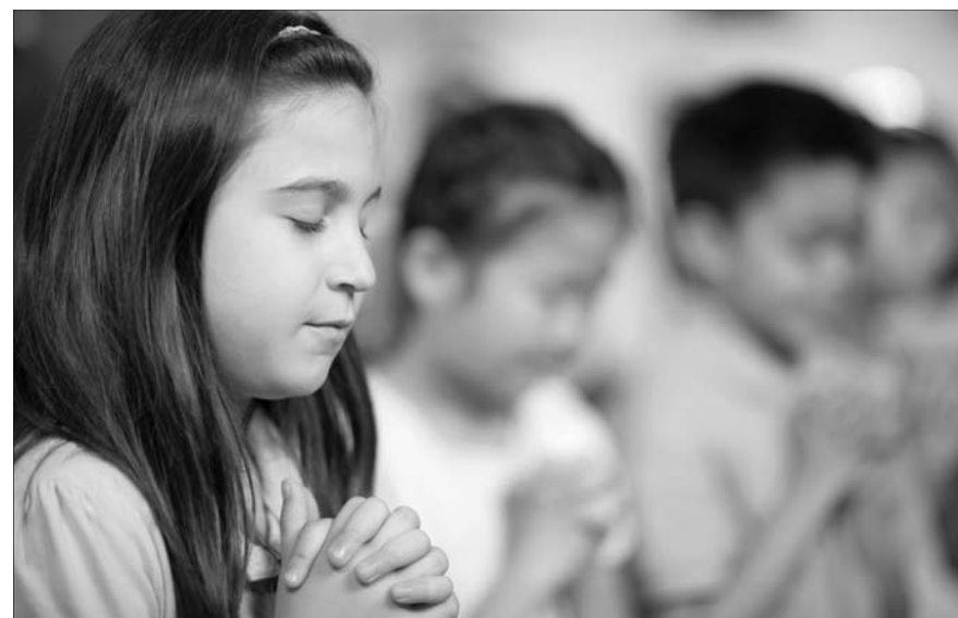
¿Quieres saber más? Estas respuestas están tomadas del YOUCAT. Consúltalo.

Con la mirada puesta en Jesús, pidámosle la fuerza necesaria para hacer mucho bien.