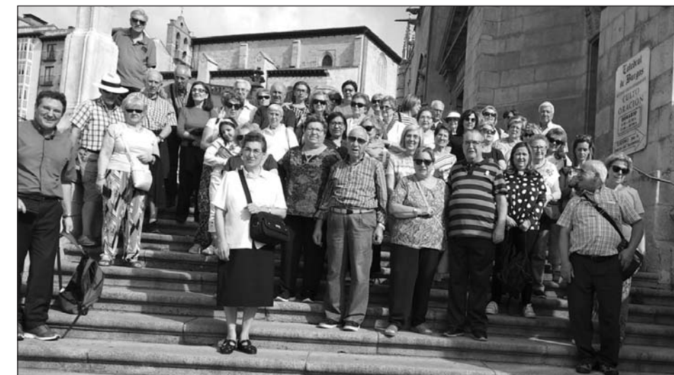
Peregrinos de la Parroquia Santa Teresa en Burgos, camino de Lourdes.

El encuentro con uno mismo y con la realidad familiar, seguro que favorecerá el encuentro con quien puede poner mayor luz en el corazón: Dios. Como cristianos necesitamos renovar la amistad con Jesús, descansar en él. Aprovecha este verano para estrenar una nueva amistad con Cristo.