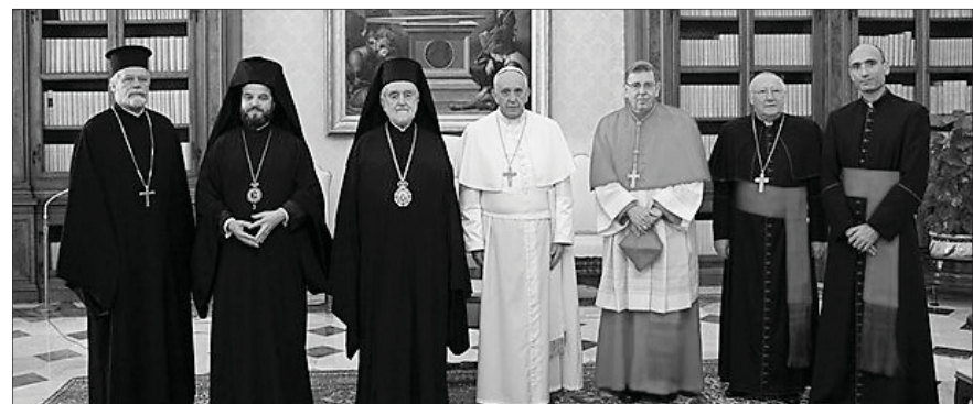
Estas respuestas están tomadas del Catecismo Joven de la Iglesia Católica. Los números que se ofrecen corresponden a la versión de YOUCAT.

Para que el escándalo de la separación desaparezca del mundo es necesaria la conversión de todos los afectados, también el conocimiento de las propias convicciones de fe y las controversias con las de los otros, pero especialmente es necesaria la oración común y el servicio común de los cristianos a los hombres.